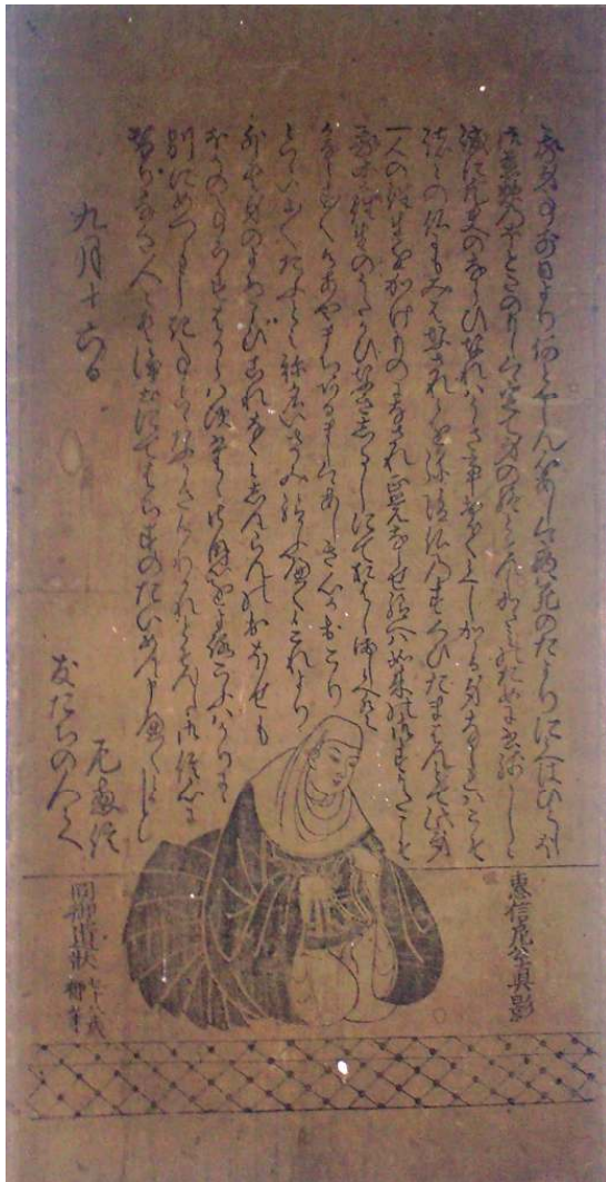
惠信尼公真影並同御遺状七十八歳御筆