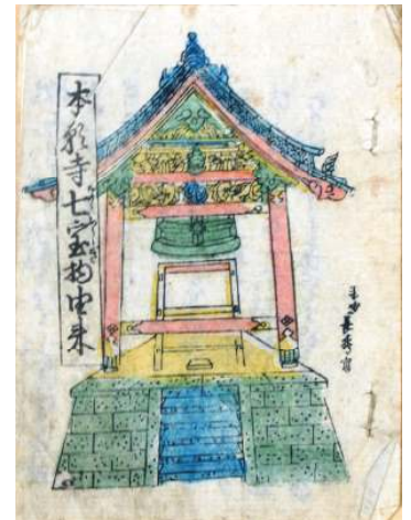
本願寺七宝物 (ななふしぎ) 由来